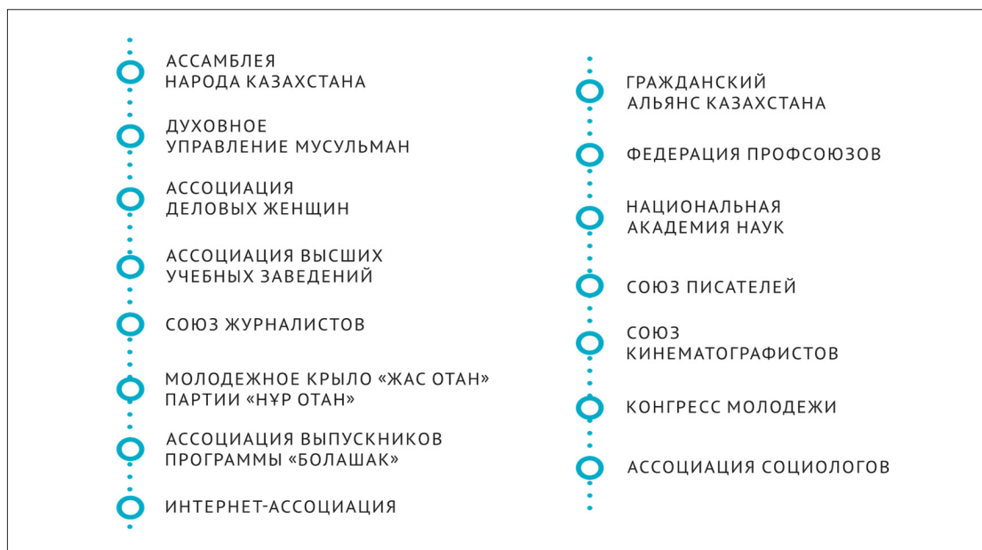
Рисунок 4 – Крупные общественные организации, ставшие участниками Открытого соглашения

Концептуальное значение средств массовой информации в деле противодействия коррупции заключается в возможности раскрыть общественности негласный инструментарий коррупции, в способности лишить ее удобного базиса для развития и распространения посредством осуществления журналистских расследований фактов коррупции и их опубликования, что должно продемонстрировать обществу и коррумпированным должностным лицам неизбежность ответственности за противоправные действия.