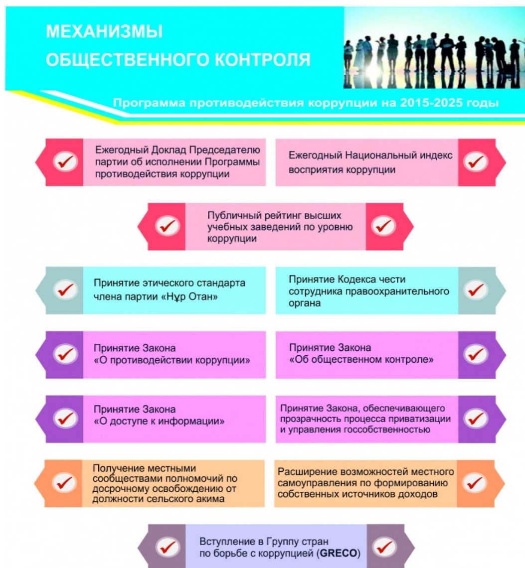
Рисунок 2 – Механизмы общественного контроля программы

В этом соглашении приняли участие более 39 тысяч организаций и 54 тысячи граждан, что явно и недвусмысленно демонстрирует повышение уровня нетерпимости граждан к коррупции и готовности к борьбе с ней (рис. 4).