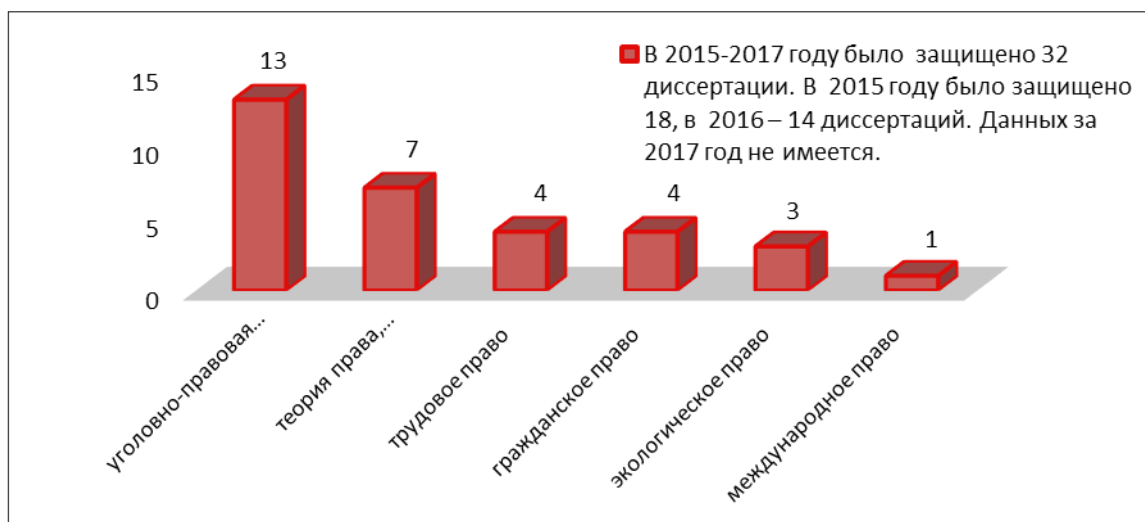
Рисунок 2 – Диссертации по отраслям права

по экологическому праву; 4 диссертаций было защищено по трудовому праву; 4 диссертаций было защищено по гражданскому праву; 7 диссертаций было защищено по теории права, конституционному праву, административному праву; диссертация была защищена по международному праву.