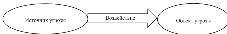
Рисунок 1 – Структура угрозы национальной безопасности

Изучение перечисленных трудов позволяет сделать вывод, что в них исследуются различные исторические условия, политические процессы, в которых осуществлялось становление Республики Казахстан. При этом, сущностные свойства выделенных угроз не являлись предметом научного поиска. Для отнесения какого-либо явления или процесса к угрозе, как правило, использовалось законодательное определение данного понятия, отражающее результаты теоретических обобщений из различных отраслей научных знаний.