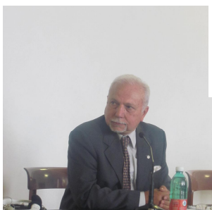
Президент Латиноамериканского института Омбудсмана - Карлос Констанла