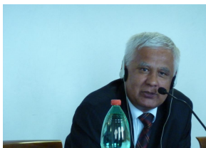
Председатель Конституционного Суда Республики Таджикистан - Махкам Махмудов