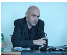
Защитник граждан Города Вероны - Стефано Андредэ Фаярдо