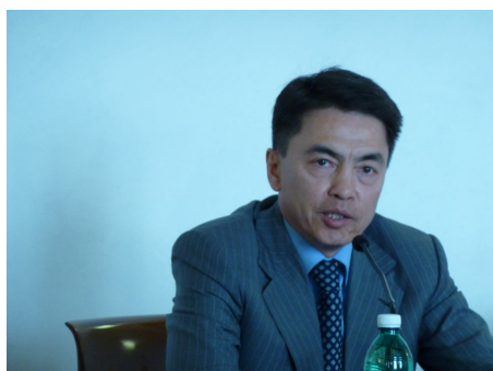
Уполномоченный по правам человека Республики Казахстан - Аскар Шакиров