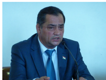
Уполномоченный по правам человека Республики Таджикистан - Зариф Ализода