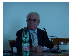
Проректор Университета Тираны (Албания) - Ксенофон Крисафиф