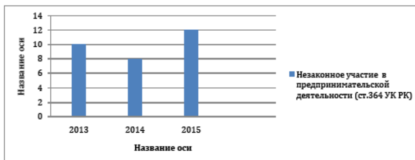
Рисунок 1 – Незаконное участие в предпринимательской деятельности (ст.364 УК РК)

правонарушений. В этой связи актуальными становятся проблемы по выявлению, раскрытию и расследованию рассматриваемых правонарушений.